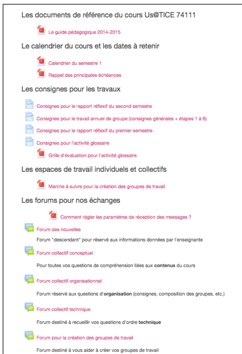
Fig. 1 – Les outils de l'environnement de cours

Vous trouverez, ci-dessous, la liste des différents outils disponibles sur la plateforme avec un moyen de les identifier et de les repérer visuellement à l'écran. La majorité de ces outils se trouvent en effet rassemblés dans la première section du cours (voir saisie d'écran, ci-dessous). Vous trouverez aussi la description de la fonction et du rôle attribué à chacun de ces outils dans le scénario pédagogique du cours.