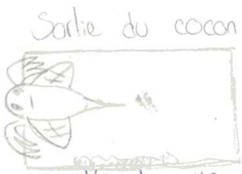
Sortie du cocon La Nymphe d'Osmie sort du cocon.

illustration: Stan Texte: Mathilde Imagination: Ines Observateur: Adeu